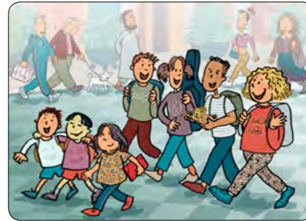
7. M'agrada anar amb la colla de camí cap a l'escola!