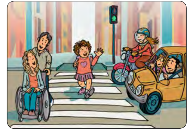
12. El vostre exemple, per a mi és un model!