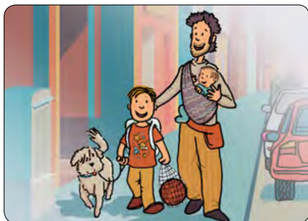
2. Quan camino, porto la Lluna ben lligada i la pilota a la bossa!