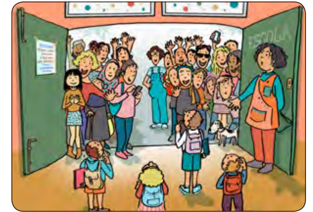
11. A la sortida, no ens apiletem, sisplau!