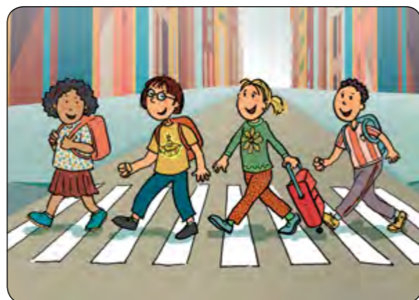
6. ...i sempre ho faig per un pas vianants!