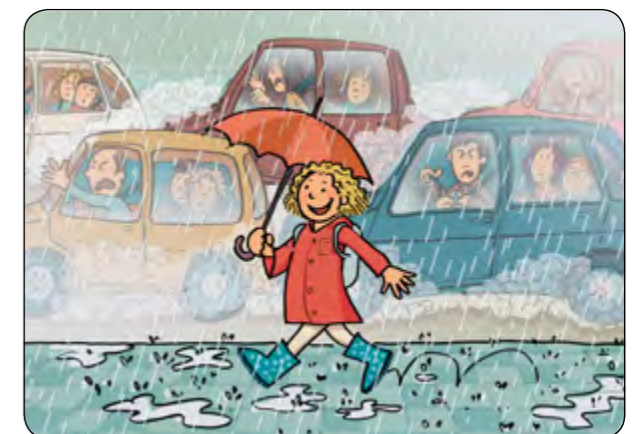
14. Quan plou, no cal que els paraigües portin rodes!