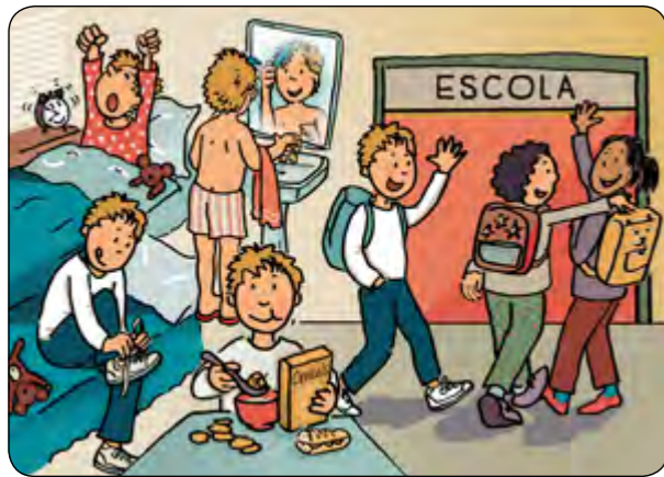
1. Em preparo amb temps i així sempre arribo puntual!