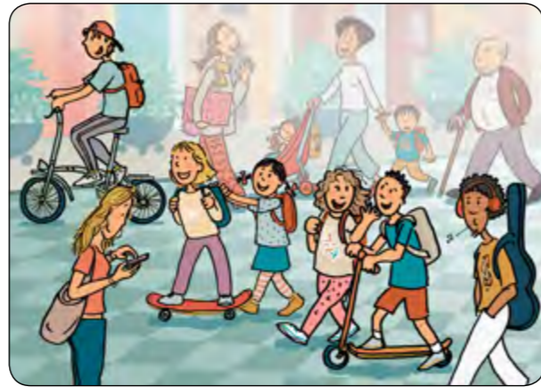
3. Si vaig amb bici, skate o patinet, compte amb la velocitat!