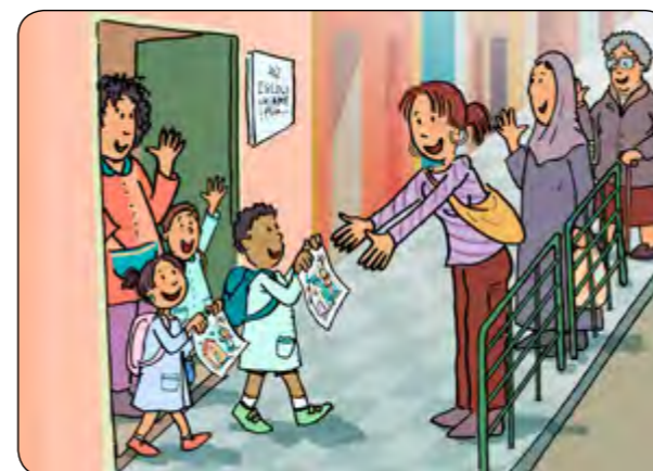
10. Vine a buscar-me per la banda de la porta i així no he de travessar.