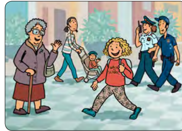
8. Però també estic contenta si un dia hi vaig tota sola.