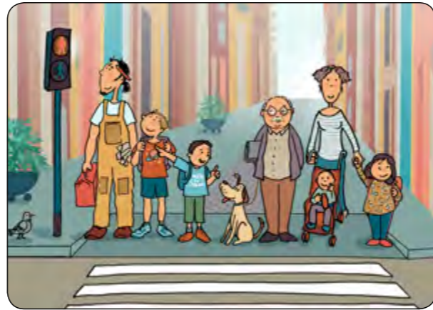
4. El semàfor... me'l miro i li faig cas!