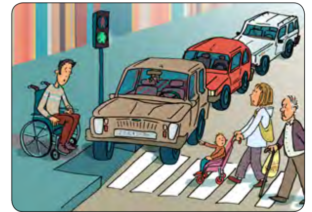
13. No aparqueu mai a sobre de la vorera o dels passos de vianants!