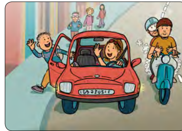
9. Si vaig en cotxe, porto el cinturó i sempre surto per la porta que dona a la vorera.